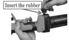
4. Włóż gumę i dokręć pokrętko. Uwaga: W przypadku DUŻYCH narzędzi.