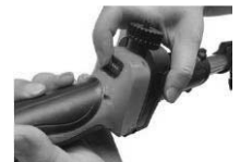
8. Uključite napajanje i pritisnite okidač. Sada ste spremni za rad.