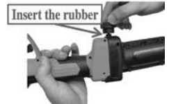
4. Inserire il gommino e stringere la manopola. Nota: per gli utensili di grandi dimensioni.