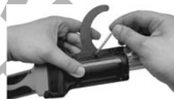
11. Insert the nut and tighten the screw.