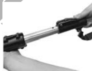
6. Press and hold the button and freely adjust the extension.