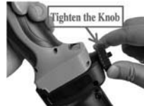
3. Non inserire la gomma, stringere la manopola. Nota: per gli utensili di piccole dimensioni.