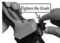
3. Не поставяйте гумата, затегнете копчето. Забележка: За инструменти с МАЛЪК размер.