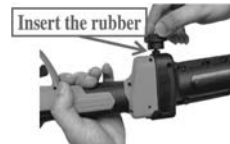
4. Insert the rubber and tighten the knob. Note: For LARGE size tools.