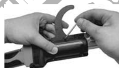
11. Поставете гайката и затегнете винт.