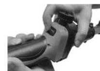
8. Porniți aparatul și apăsați pe trăgaci. Sunteți acum gata de lucru.