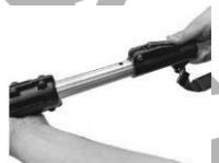
6. Pritisnite i držite gumb i slobodno podesite produžetak.