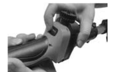
8. Accendere l'apparecchio e premere il grilletto. Ora siete pronti a lavorare.