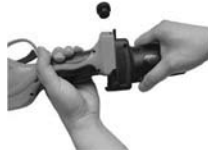
2. Collegare l'utensile alla testa della barra di estensione.