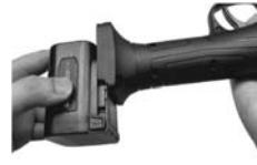
7. Bateria jest podłączona do końca paska.