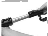
6. Apăsați și mențineți apăsat butonul și reglați liber extensia.