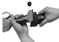
2. Spojite alat na glavu produžetka.