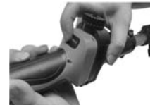
8. Włącz zasilanie i naciśnij spust. Urządzenie jest gotowe do pracy.