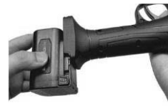
7. Baterija je spojena na kraj šipke