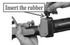
4. Поставете гумата и затегнете копчето. Забележка: За инструменти с голям размер.