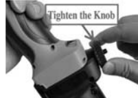
3. Nie wkładaj gumy, dokręć pokrętko. Uwaga: Dla MAŁYCH narzędzi.