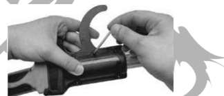
11. Umetnite maticu i zategnite vijak.