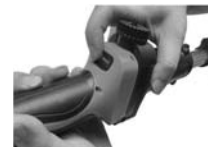
8. Turn the power on and press the trigger. You are now ready to work.