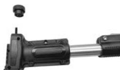
1. Loosen the knob.