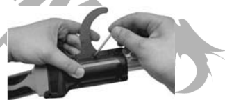
11. Inserire il dado e serrare il vite.