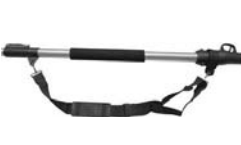
5. Installare la cinghia.