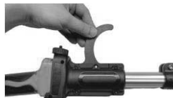
10. Umetnite kuku u prazan utor u glavi šipke, s kukom okrenutom prema dolje.