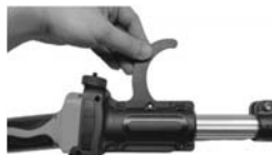
10. Insert the hook into the empty slot in the bar head, with the hook pointing downwards.