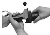
2. Conectați scula la capul de prelungire a barei.