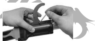
11. Introduceți piulița și strângeți șurub.