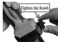
3. Ne umetajte gumu, zategnite gumb. Napomena: Za ALATE MALIH dimenzija.