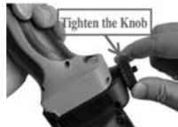
3. Do not insert the rubber, tighten the knob. Note: For SMALL size tools.