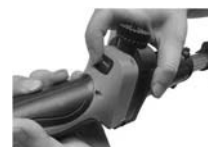
8. Включете захранването и натиснете спусъка. Вече сте готови за работа.