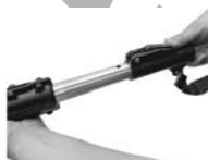
6. Натиснете и задръжте бутона и свободното регулиране на удължението.