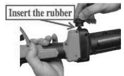
4. Umetnite gumu i zategnite gumb. Napomena: Za ALATE VELIKIH dimenzija.