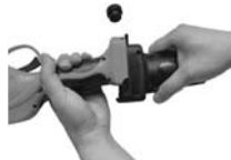
2. Connect the tool to the extension bar head.