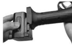
7. The battery is connected to the end of the bar